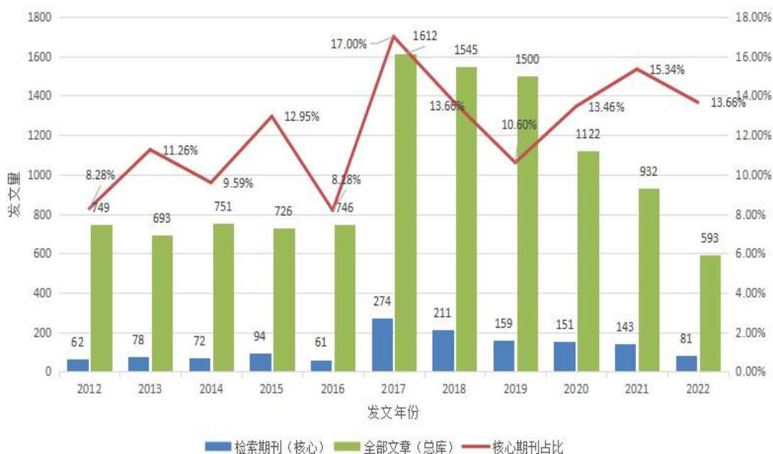
图1.1 2012—2021年文献年度分布走势图

通过分析CNKI数据库中以“高校思想政治工作”为主题的研究文献发文量(总发文量与核心发文量),绘制出“高校思想政治工作”相关文献年度分布走势图(见图1.1),以“量”的分析呈现国内学术界有关“高校思想政治工作”研究概貌。