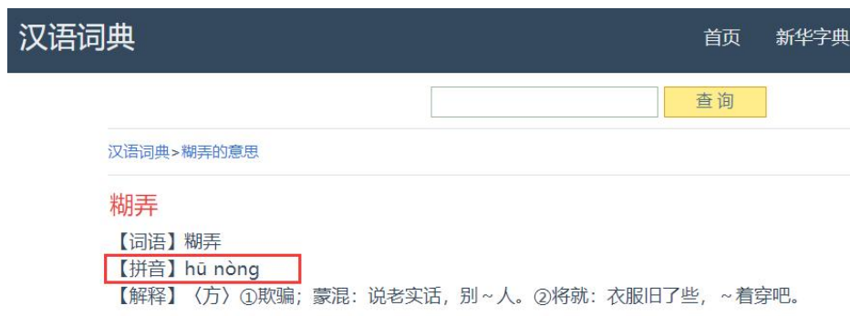
图 2.2 汉语词典中糊弄一词的读音截图