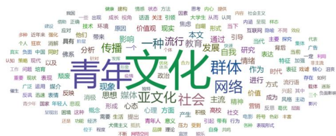
图 1.2 “丧文化”研究词云图

以与上述青年亚文化部分内容相仿之法,在知网共获取 96 篇有效文献。将此 96 篇有效文献汇集成表后,利用智分析(SmartAnalyze)得到以下词云图。