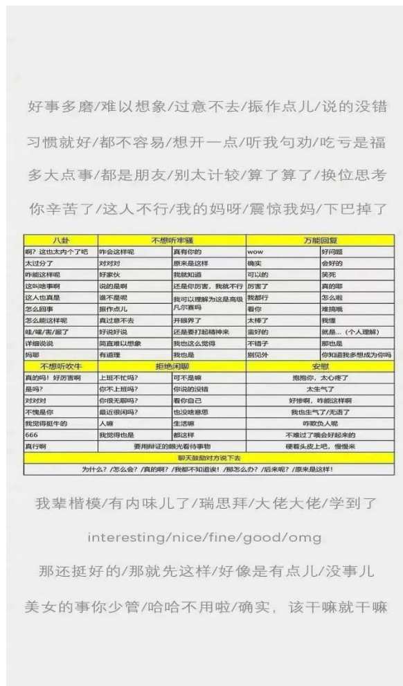
图 3.1 “糊弄学”语录壁纸

这些“糊弄”话术无不彰显青年群体的幽默与生活智慧，能够消解生活中遇到的无意义打扰与尴尬。迷恋、学习、践行“糊弄学”的人通过学习这些类似的话术，凝聚为一个群体，使用商讨出的有效话术或借鉴其他用户已经使用过并获得成功的经验去应付生活中遇到的需要进行“糊弄”的情况。诸如上述例子的话术与公式看似统一，实则可以被运用到多个实际社交情境中，一定程度上灵活地解决人际交往中的难题。