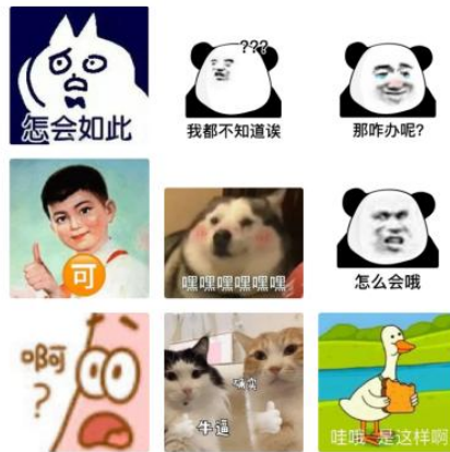
图 3.2 “糊弄学”表情包（网络下载）

公众号意林作文在 2021 年 1 月 3 日的推文中为用户分享一组表情包，文中这样描述“发现有一些表情包很好用，就是对面说什么都能发过去的那种……因为有时候确实不知道回啥，又不能显得太冷淡。今天来给大家分享一下万能的糊弄表情包~”这一类表情包在聊天等网络社交情境中的广泛应用使“糊弄学”的风格更加突显。