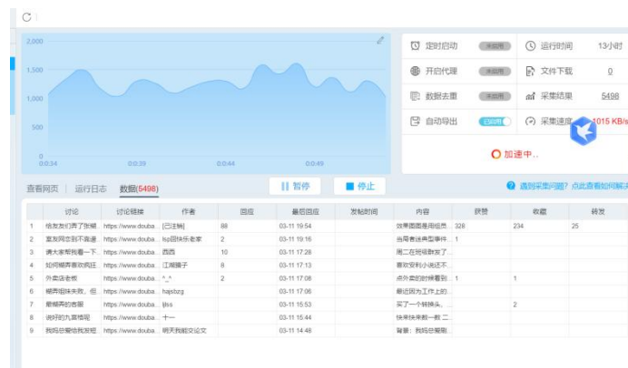
图 4.1 数据采集过程图

在确定需采集的数据内容及特征、采集数据的格式后，本文利用现有的新一代网页采集软件后羿采集器对豆瓣“糊弄学”小组自2021年12月8日起出现在网页版小组的数据进行部分采集。获取的字段包括：讨论（即帖子标题）、URL（讨论链接网址）、作者（发帖人昵称）、回应数量、发帖内容、获赞数量、收藏数量以及转发数量等。经过软件自动抓取，历时13小时共采集并导出5509条数据。