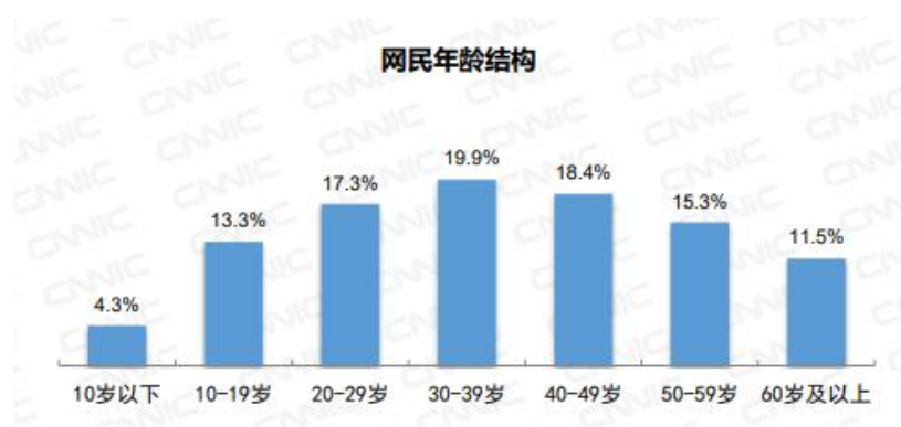
图 1.1 网民年龄结构，图源：CNNIC 中国互联网络发展状况统计调查（2021.12）

2022年2月25日，中国互联网络信息中心（CNNIC）发布第49次《中国互联网络发展状况统计报告》，据该报告数据显示，截至2021年12月，我国网民规模为10.32亿 1 ，青年是互联网使用主要群体。