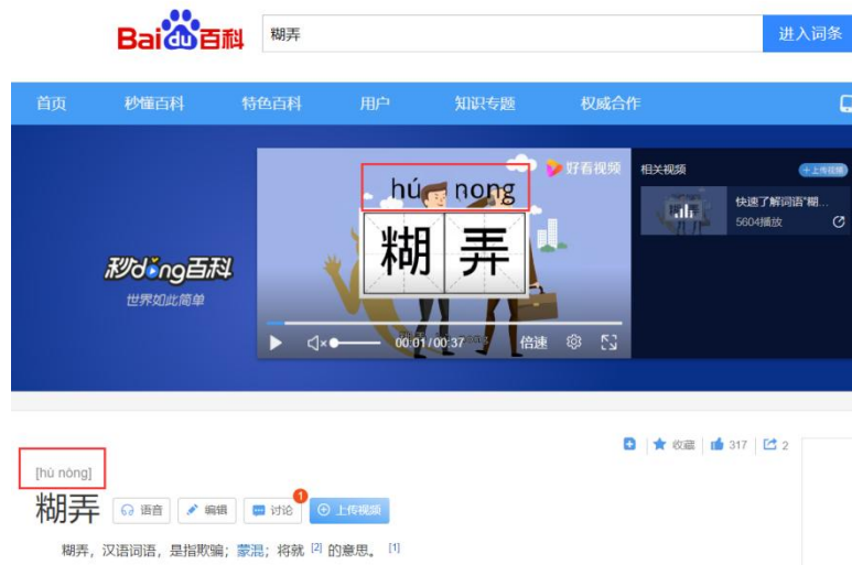
图 1.1 百度百科上关于糊弄一词的读音有出入 网络截图

本研究认为“糊弄学”是指年轻人面对让人感到有压力、不想继续深入探讨的对话及其他社交情境，迫于对方身份不得不回应时，选择以一种圆滑而不被察觉或不被反感的方式继续对话的办法。这是青年群体的一种生活态度，他们通常希望在人际交往中以此达到“四两拨千斤”的效果，也是一种处世技巧，能够通过这种方式应对生活中难以推脱又不情愿的事。争论“糊弄学”有没有必要出现、年轻人在生活中该不该学习这种态度、使用这种技巧是无意义的。当下，越来越多的年轻人已经开始接触、学习并进行实践，即使某些人对此进行批驳或表达反对意见，仍无法保证自己不会成为被糊弄的对象。