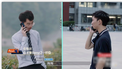
图 4.7 广告宣传效果